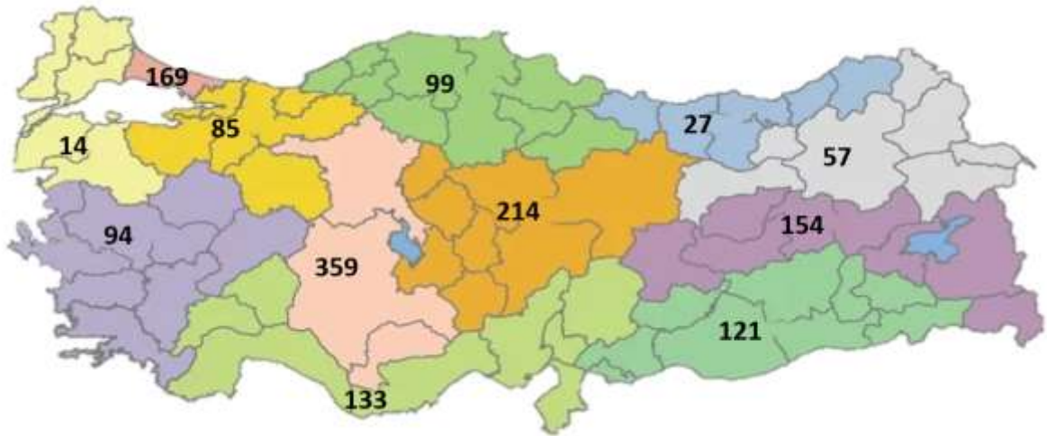
řekil 1: İBBS-1'e Gre Yeni COVID-19 Vaka Sayısı, Trkiye